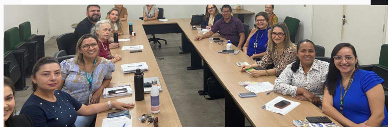
Grupo Condutor da Rede de Atenção à Saúde da Paraíba