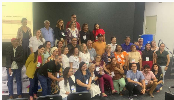
Conselho Municipal de Saúde de João Pessoa e Conselho Estadual de Saúde da PB