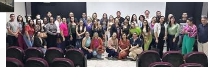
Grupo Condutor da Programação da Atenção Especializada em Saúde- PAES